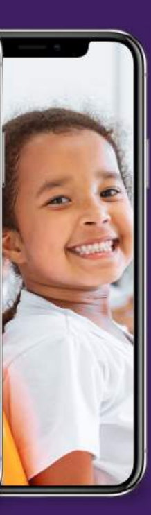
Vol.1 Da Horta ao Prato